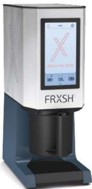
FRXSH Mousse Chef con soporte de contenedor