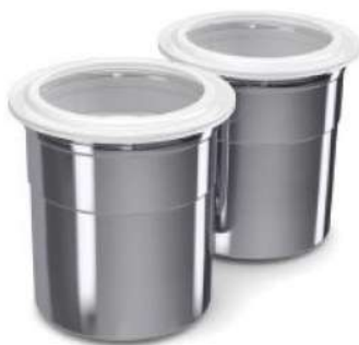
2 Contenedores con tapa de sellado