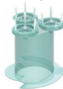
Accesorio de limpieza